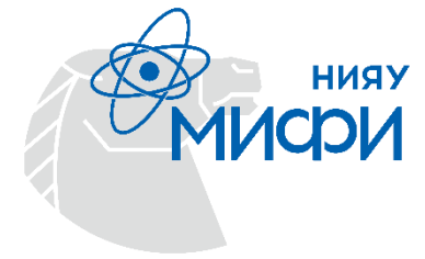
График приёмной кампании