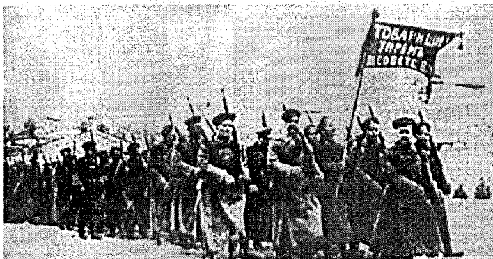
Отряд Красной армии в 1918 году