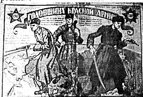
Плакат 1920 года

23 февраля 1918 года вошло в историю как день патриотического подъема россиян: день массового создания отрядов Красной армии, день первых успехов на фронте борьбы с немецкими захватчиками.