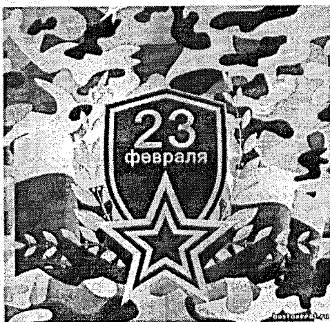
Современный плакат, посвященный Дню защитника Отечества

23 февраля – праздник поистине всенародный. Он отмечается не только в воинских частях, но и в коллективах учреждений и предприятий страны, во многих семьях. Так же как 8 Марта – праздник всех женщин России, так 23 февраля – праздник всех мужчин. Это закономерно, ведь каждый мужчина в нашей стране – защитник Отечества. В Конституции России записано: «Защита Отечества является долгом и обязанностью гражданина Российской Федерации». Так было всегда, при Александре Невском и при Петре I, так было во времена войны с Наполеоном в 1812 году и во время Великой Отечественной войны 1941–1945 годов.