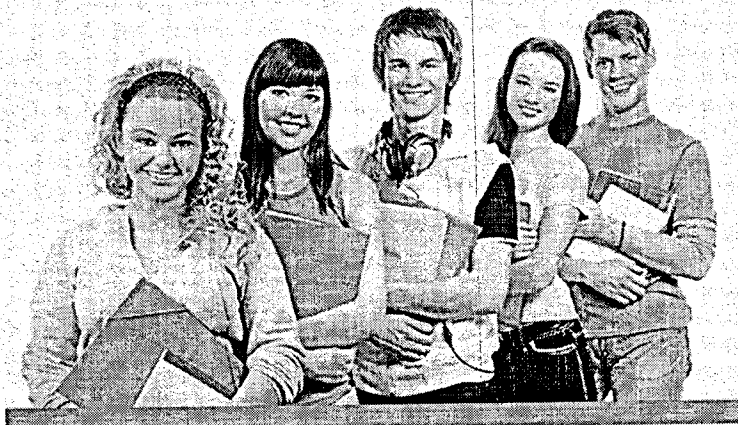
Рисунок 1 – Авторизация на портале http://www.online-gia.ru/

Шаг 3. Внимательно прочитать краткую инструкцию по выполнению работы (рисунок 2).