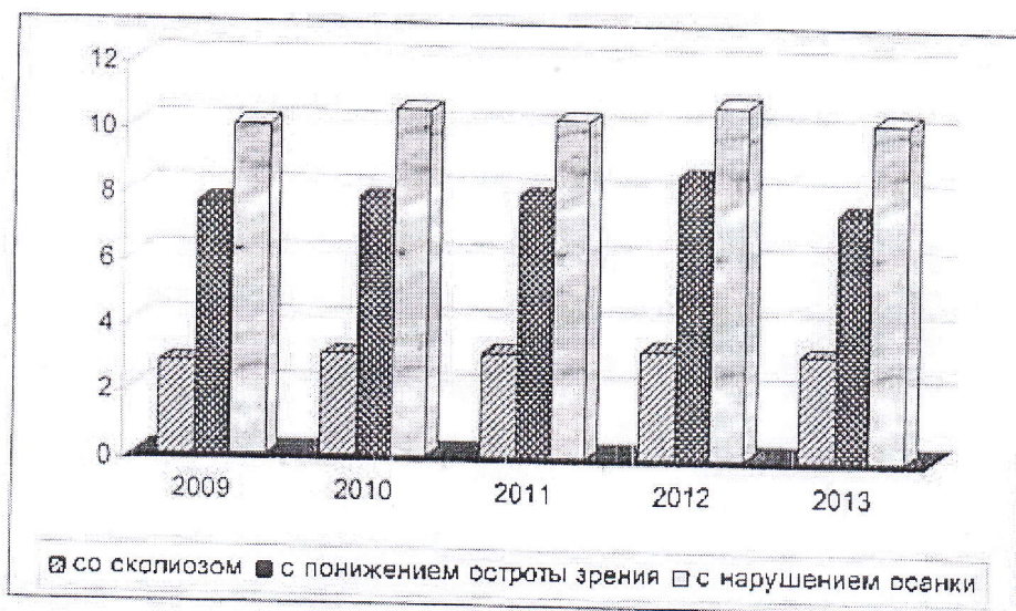
Удельный вес детей и подростков-школьников до 17 лет с нарушениями зрения и опорно-двигательного аппарата от общего числа осматриваемых (на 100 осматриваемых) по данным профилактических осмотров в 2009-2013г.г.

Удельный вес нарушения осанки у детей и подростков школьников в возрасте до 17 лет продолжает оставаться высоким (в 1,4 раза выше, чем в среднем по РФ).